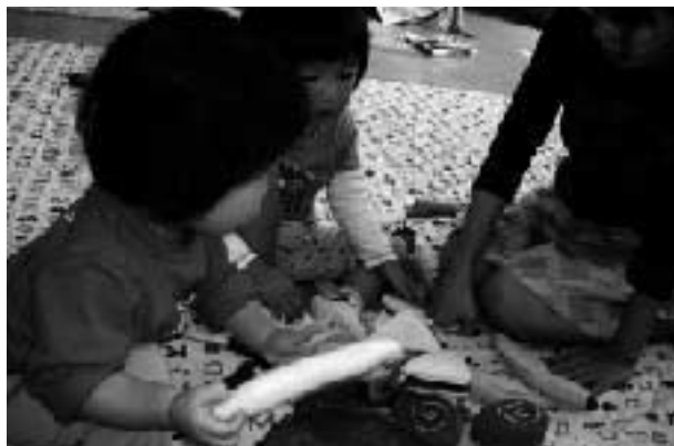
どっちにしようかな?

今はまだ参加者は多いとはいえませんが、子どもからお年寄まで、散歩のついでにちょっと寄り道してみませんか。お待ちしております。