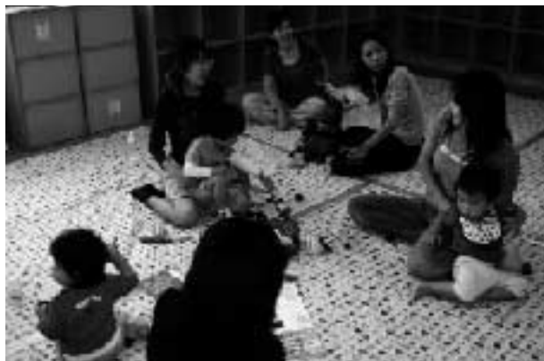
お母さんの情報交換の場にも…