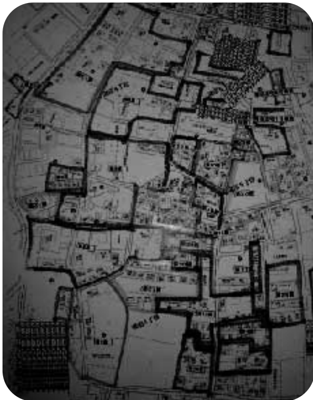
溝沼第二町内会区域地図

今後は、町内会に加入していない方も含め、支える側も支えられる側もなく、地域の住民全員がお互いに支えあえる地域づくりを目指していきたいと考えています。